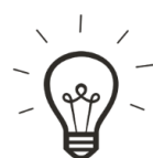
TABLEAU DECISIONNEL ASTIGMATISME

Délai de livraison : 7 à 10 jours ouvrés